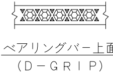
ベアリングバー上面 (D-GRIP)